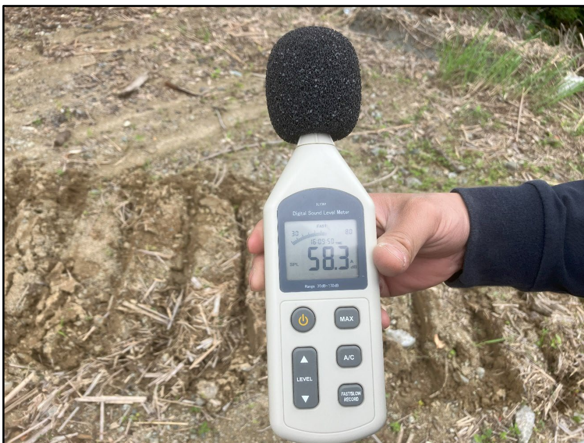
図-2 調査状況と結果